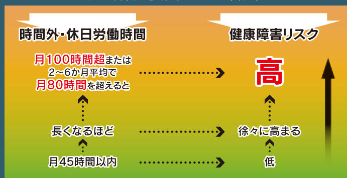
過重労働と健康リスクとの関連性

(右の図は、労災補償に係る脳・心臓疾患の労災認定基準の考え方の基礎となった医学的検討結果を踏まえたものです。)