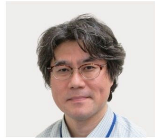
独立行政法人労働者健康安全機構 埼玉産業保健総合支援センター

第二に、数日間にわたって睡眠の状況とともに、困っている他人を援助しようとする程度を調べました。その結果、睡眠の質が良いほど、他人を助ける意欲は高くなりました。