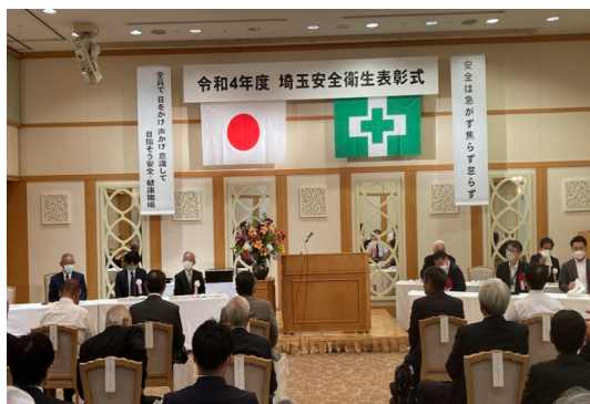
埼玉県安全衛生表彰式