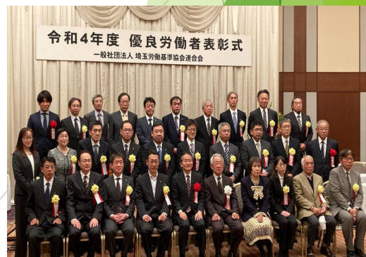
優良労働者表彰式