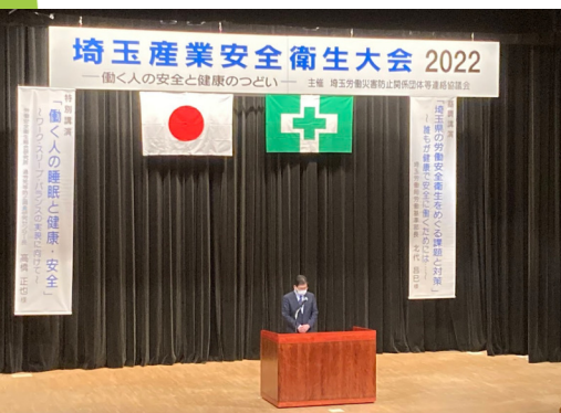
埼玉産業安全衛生大会